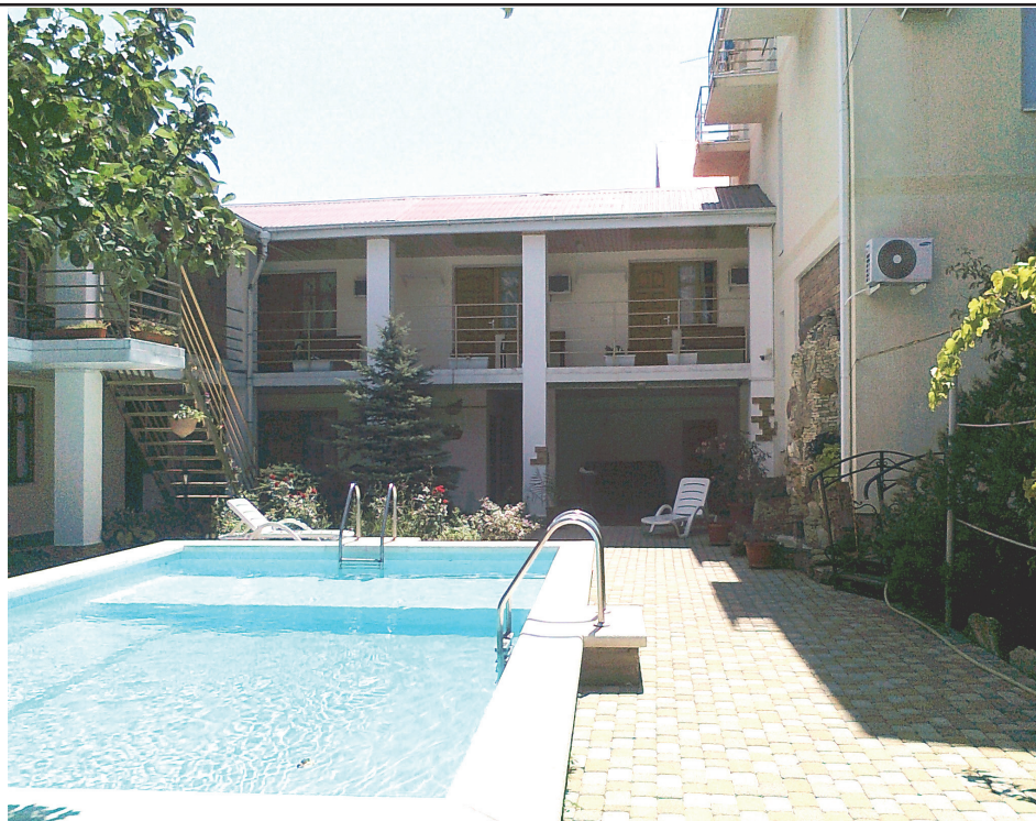
Рис. 1. Место проведения наблюдения

Большое разнообразие действий было связано с мячом. Во-первых, плавающие игроки перебрасывали друг другу мяч. Во-вторых, некоторые забавы проходили не в воде.