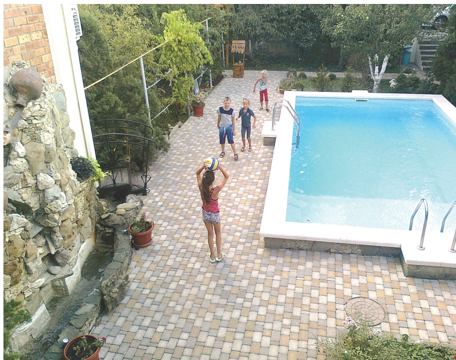
Рис. 5. Дети играют «в собачку»

Детям вменяют в вину, что они не хотят и не умеют играть. Они только «слоняются» из угла в угол. Наблюдения показывают, что детское сообщество имеет высокую степень самоорганизации. Так, без советов взрослых дети затевали рядом с бассейном игру в мяч, например, «в собачку», смысл которой заключается в том, что между двумя детьми, стоящими лицом друг к другу на расстоянии, встает ребенок или несколько детей («собачек»), которые должны поймать мяч, перекидываемый над ними играющими (см. рис. 5).