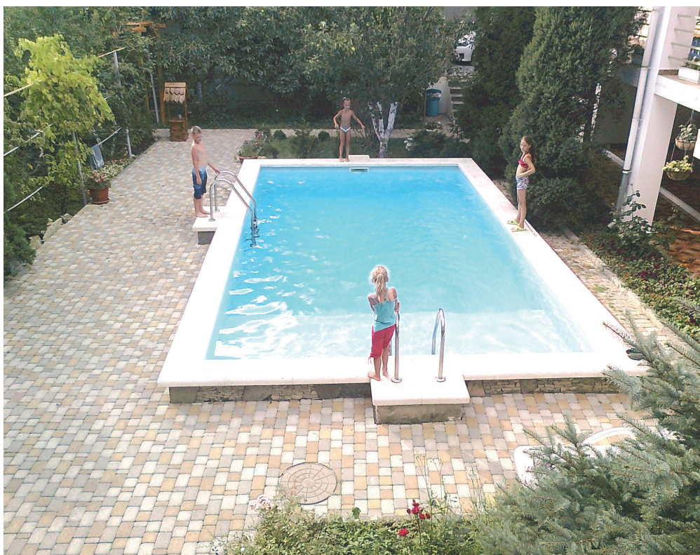
Рис. 2. Дети играют в мяч на бортике бассейна

Например, четыре игрока перебрасывают друг другу мяч, стоя на бортике (см. рис. 2).