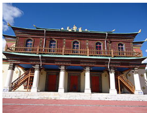
Рис. 3. Агинский дацан (см. прим. 8)