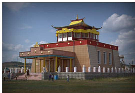
Рис. 2. Эгитуиский дацан (см. прим. 8)

Территориальная близость к Эгетуискому и Агинскому дацанам (см. рис. 2 и 3) Бурят-Монгольской АССР, располагавшимся примерно в 160,5 – 214 км (150 – 200 вёрстах) от национальных районных центров (см. прим. 8), давала возможность сотням лам, «беспечно проживавшим в дацанах, периодически совершать свои божественные налёты на улусы наших бурят» (см. прим. 6, л. 48).