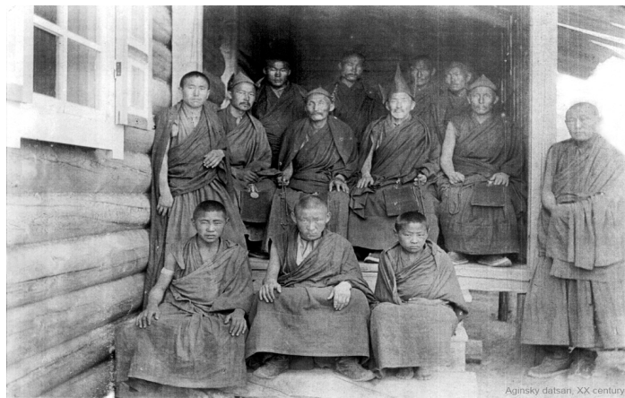
Рис. 4. Духовенство Агинского дацана, 1920-е гг. (см. прим. 8)

государственного обеспечения ...» [8, 78]. В 1926 – 1927 учебном году в национальных районах Читинского округа действовали 6 начальных школ с 4-летним сроком обучения, в которых образование получали 237 чел., или примерно 20 – 25 % от общего числа детей школьного возраста, в 1927 – 1928 учебном году – 9 школ. Во вновь открытых школах в течение 2 лет обучались так называемые переростки, т. е. подростки в возрасте от 11 до 15 лет.