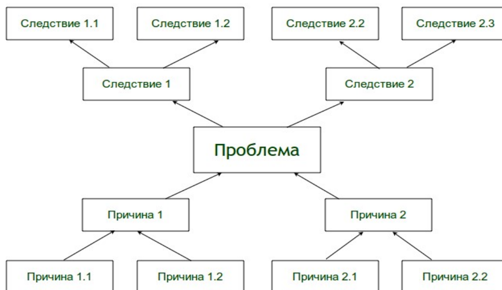
Рис. 1. «Дерево проблем»

Для реализации данного принципа целесообразно построить «дерево проблем» (см. рис. 1), где прослеживаются причинно-следственные связи анализируемых проблем.